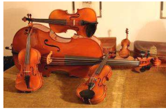
Kindercello, umrahmt von kleinen Geigen