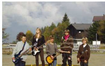
Bolliger Band oNce MoRe

Sonntag, 20. Mai, 19.00 Uhr Reberhaus Bolligen Nach zwei intensiven Probewochen- enden im Rahmen des "Band Camp" der Musikschule Unteres Worblental treten junge Nachwuchskünstler/innen mit ihren Bands öffentlich auf.